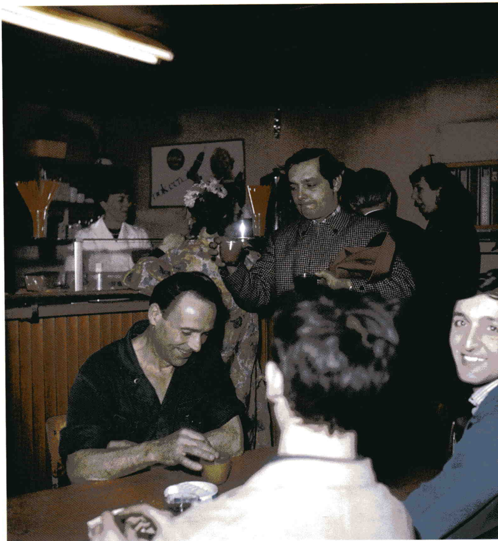
Italiaanse gastarbeiders drinken een koffie in Casa Italiana in Amsterdam trefpunt voor vooral Italiaanse gast (jaren '60).