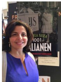
Auteur Daniela Tasca