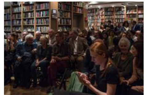
Lancering bij Boekhandel van Rossum