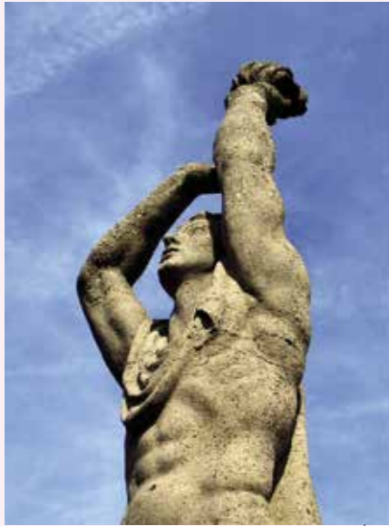
'Voor omgekomen sportbeoefenaars'. Oorlogsmonument Olympisch Stadion Amsterdam, fragment. Gemaakt in 1947 door Fred Carasso